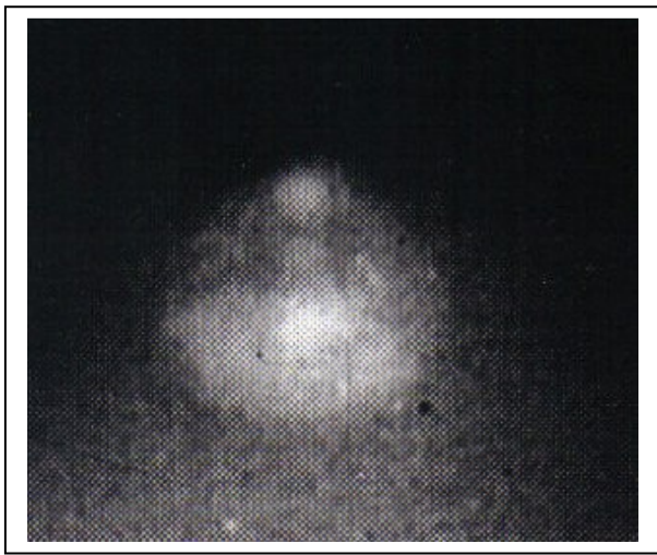
Ampliación del reflejo de Sóller, 12/11/1979.