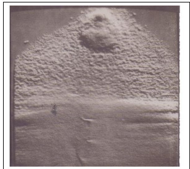
Mejora de bordes ( edge enhancement ), Sóller, 12/11/1979.