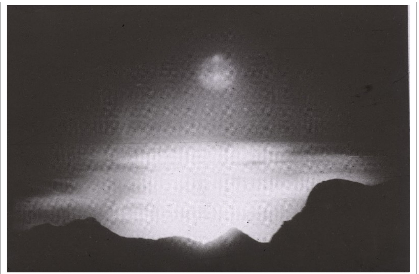
Reflejo solar. Sóller (Mallorca), 12 de noviembre de 1979.

La fotografía es una escena en blanco y negro de lo que presumiblemente es una puesta o salida de Sol. La luz solar es tan poderosa que su deslumbramiento sale tras de una colina. Las nubes son evidentes en el horizonte. Una gran imagen redonda, con dos pequeños objetos brillantes en su interior, aparece sobre el Sol. La imagen tiene todas las características de un reflejo en las lentes (lens flare). Es difusa y más brillante que el fondo, está en el lado opuesto de la verdadera fuente de luz, el Sol, con respecto al centro de la foto y su eje de simetría mira al Sol.