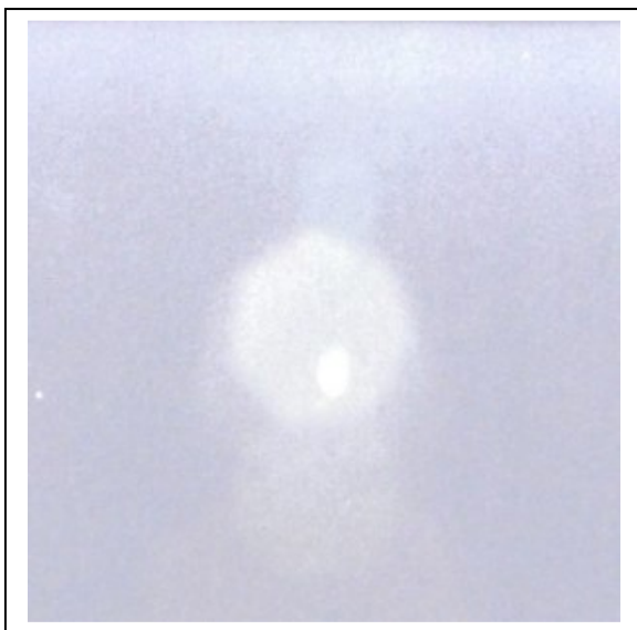
Ufología comparada: Ampliación del reflejo de Cos, 31/10/1999.